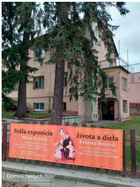
Domov bielych hláv