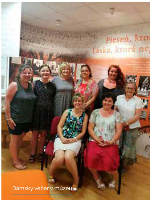
Dámsky večer v múzeu